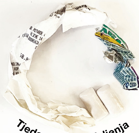
Tjedan kulture življenja