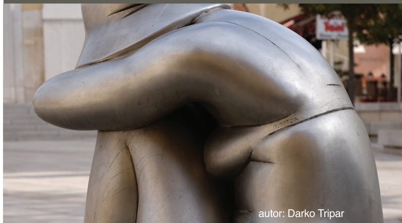
autor: Darko Tripar

Nakon toga Riviera i naredne godine daruje gradu Poreču treću skulpturu koja se smjestila ispred zgrade općinske uprave, rad akademskog kipara Stanka Jančića. Nakon postavljanja treće skulpture postaje jasno da skulpture daju gradu osobitost, pridonose estetskom doživljaju njegove arhitektonske i urbane posebnosti, daju mu edukativnu i humanu dimenziju te funkcioniraju kao svojevrsna jedinstvena zbirka suvremene umjetnosti. Skulpture se postavljaju i sljedećih godina sve do početka Domovinskog rata kada se praksa prekida do 1995. godine i nastavlja do postavljanja posljednjih u nizu skulptura koje su financirane iz gradskog proračuna. Ukoliko izuzmemo velikane poput Ivana Meštrovića i Vojina Bakića, u toj zbirci skulptura predstavljeni su radovi gotovo svih najznačajnijih suvremenih hrvatskih kipara. U tom smislu skulpture ostvaruju edukativnu funkciju te domaćima i gostima predstavljaju djela našeg suvremenog likovnog stvaralaštva.